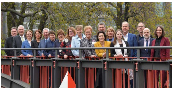
Mitglieder 14. Integrationsministerkonferenz 2019

Im April 2019 fand in Berlin zum 14. Mal die Konferenz der in den Bundesländern für Integration zuständigen Ministerinnen und Minister sowie Senatorinnen und Senatoren statt. Die Konferenz stand unter dem Motto „Ankommen. Teilhaben. Bleiben“ und hat sich ausführlich mit den Herausforderungen des gesellschaftlichen Zusammenhalts auseinandergesetzt.